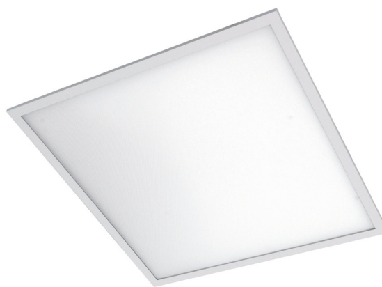
MP- klosz mikropryzmatyczny

Oprawa przeznaczona do montażu na suficie. Stosowana w biurach, szkołach, ciągach komunikacyjnych, toaletach, magazynkach, pomieszczeniach socjalnych, centrach handlowych, delikatesach, ekspozycjach, butikach, galeriach, holach, muzeach, hotelach.